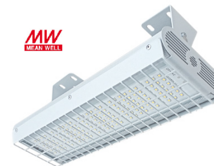
Рис. 1. Светильник «Модуль СПОРТ-2», IP67.