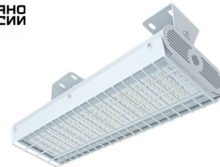
Рис. 1. Светильник «Модуль СПОРТ-2», IP67.