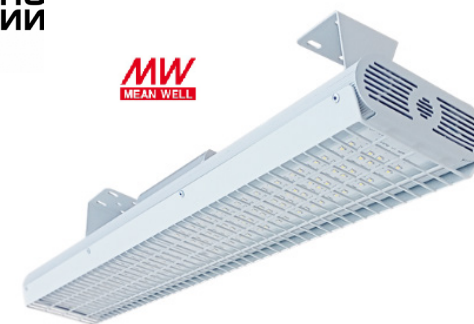
Рис. 1. Светильник «Модуль СПОРТ-2», IP67.